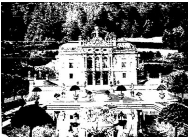
LE CHÂTEAU DE LINDERHOF, VU DE LA GRANDE TERRASSE

Le roi Max se trouvant alors à Francfort, à la Diète des princes allemands, ce fut la reine Marie qui reçut Bismarck. Celui-ci se hâta de noter les détails de ce qu'il avait vu pendant les repas donnés à Nymphenbourg en son honneur. Assis à côté de Louis, il l'observa de ce regard auquel rien n'échappait. Le jeune prince lui parut absorbé dans ses pensées. Il avait l'air «de n'être pas à table et ne se souvenait que de temps à autre de son intention de s'entretenir avec lui». Dans la conversation d'ailleurs banale et qui ne sortit pas des propos de cour ordinaires, Bismarck remarqua pourtant «de la vivacité»; il trouva le jeune homme «bien doué» et surtout il fut frappé de le trouver pénétré «du