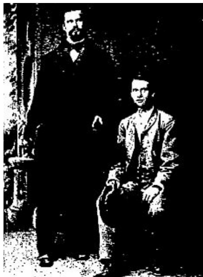
LOUIS II, VERS LA FIN DE SA VIE, AVEC L'ACTEUR JOSEPH KAINZ

Cependant, Louis II n'avait pas renoncé à son vaste projet de théâtre