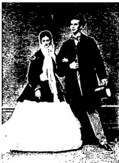
LOUIS II, AU DÉBUT DE SON RÈGNE, AVEC SA FIANCÉE, LA DUCHESSE SOPHIE