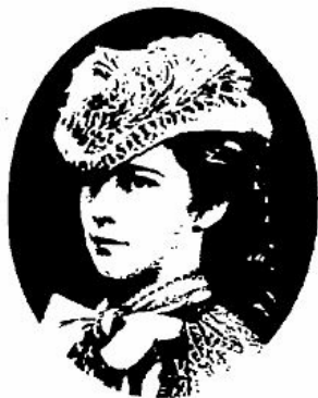
L'IMPÉRATRICE ÉLISABETH D'AUTRICHE

Il y a un curieux petit roman de Stendhal, Armance , où l'on voit un amoureux hésiter, temporiser, laisser échapper toutes les occasions pour des raisons mystérieuses. À la fin, le secret se découvre, c'est un secret physiologique. Louis II fut-il retenu par une appréhension de la même nature? On l'a beaucoup affirmé. Pareil au personnage d' Armance , il aurait, à plusieurs reprises, demandé que le mariage fût différé, et c'est le père de la princesse Sophie, alarmé, qui aurait pris l'initiative de la rupture. Cependant, des fantaisies plus bizarres encore avaient pu jeter l'inquiétude dans la famille du duc Maximilien. Il passait par le cerveau de Louis II de trop étranges caprices. S'adonnant déjà à des habitudes de vie nocturne, il ne reculait pas devant l'idée de faire porter, à l'heure où dort le commun des mortels, des fleurs ou un bijou à sa fiancée. Et ce n'était pas tout: si l'aide de camp chargé de cette mission de confiance ne rapportait pas une lettre de remerciements, c'était un