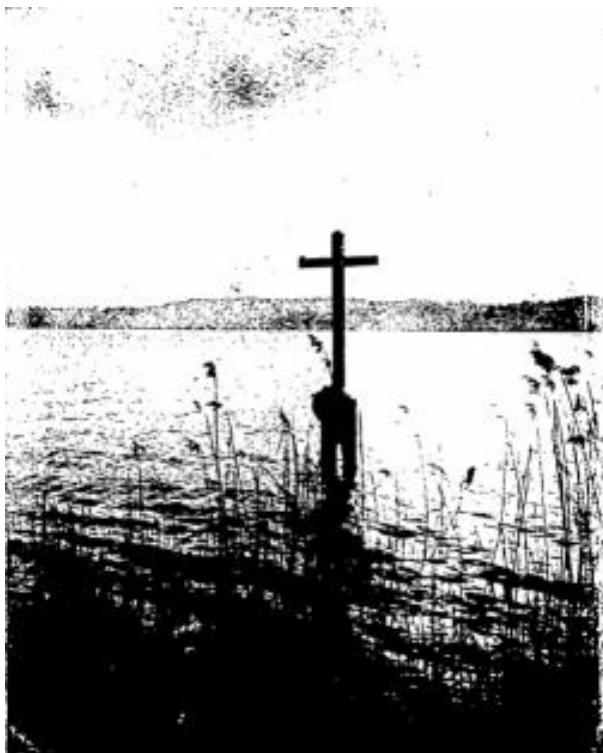
Le revers de la couverture montre La Croix commémorative élevée sur la rive du lac de Berg, à l'endroit où fut retrouvé le cadavre de Louis II.

Mais nous, Français, ne devons-nous pas garder de la reconnaissance à ce confédéré de l'Empire, pour le témoignage qu'il a porté en faveur de la primauté de notre civilisation et de nos arts? Louis II se sera trouvé d'accord avec le plus célèbre écrivain allemand de l'âge nouveau pour préférer l'esprit français à l'esprit germanique, pour avertir l'Allemagne qu'elle retournait à la barbarie en rejetant la tutelle du goût français. Frédéric Nietzsche a donné ses raisons: Louis II a construit ses châteaux. Ce n'était évidemment pas assez pour nuire à la solide construction