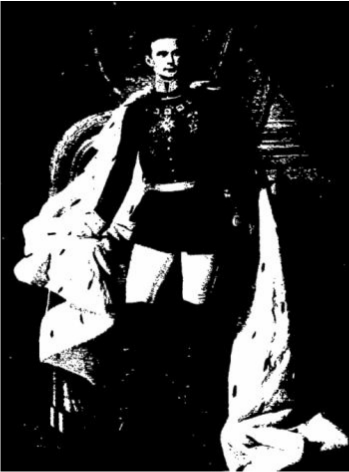
LE ROI LOUIS II d'après un tableau de Ferdinand Piloty